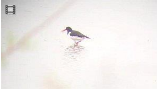
Getteröns Naturum - Strandskata.