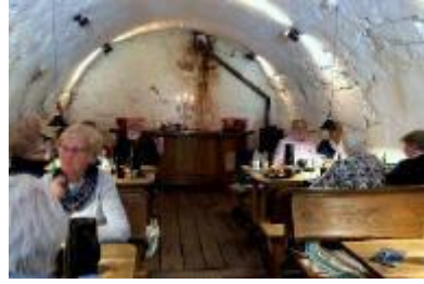
- - Öströös rökta lammfiol