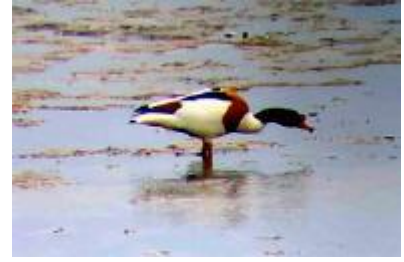
Getteröns Naturum - Gravand