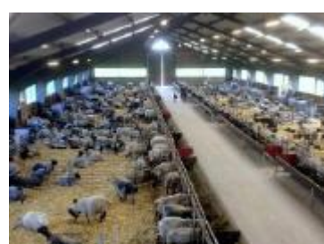
Fårstallet i Öströö med 450 nyfödda lamm