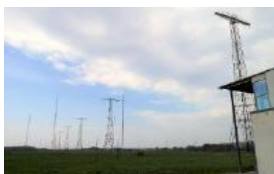
Grimetons antenn består av sex master på vardera 127 meters höjd