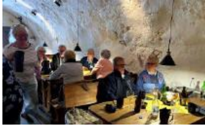
Lunch i Öströös restaurang - -