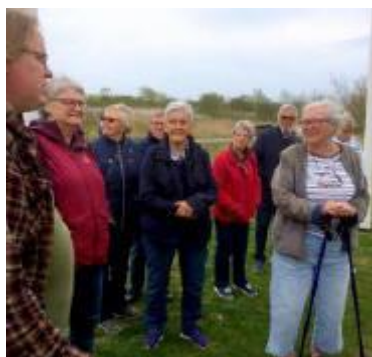
Fågelskådare på Getterön