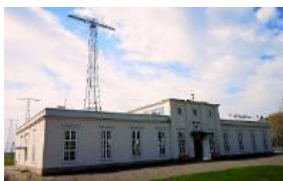
Grimeton utanför Varberg.